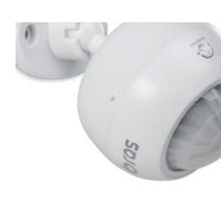
ESP 360 A