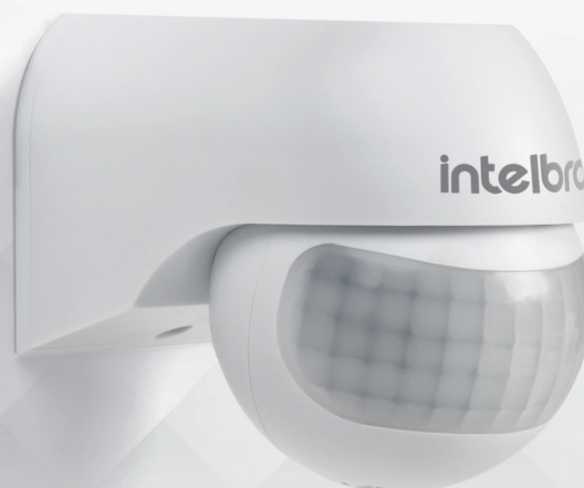
Sensor de presença para iluminação