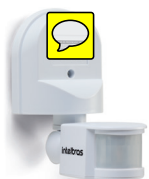
ESP 180 AE