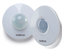
ESP 360 e ESP 360 +