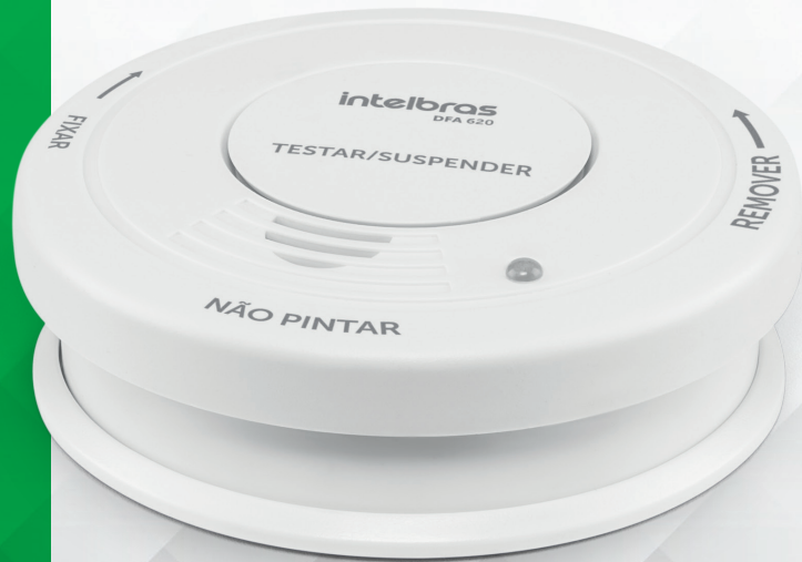
Detector de Fumaça Autônomo