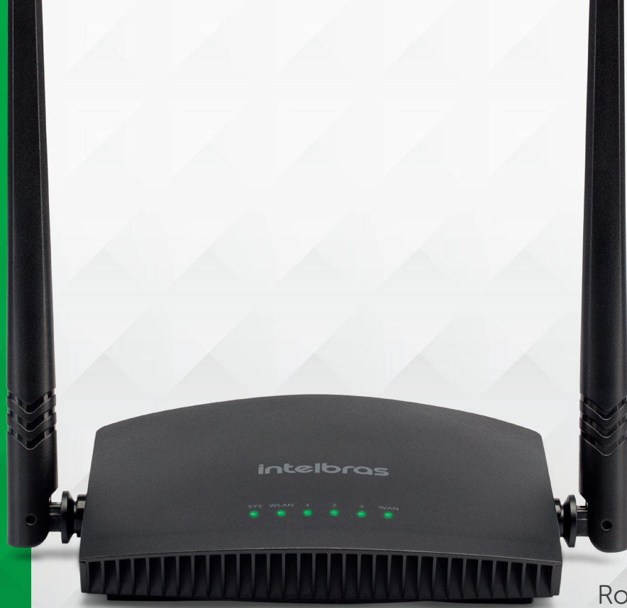
Roteador Wi-Fi N 300 Mbps