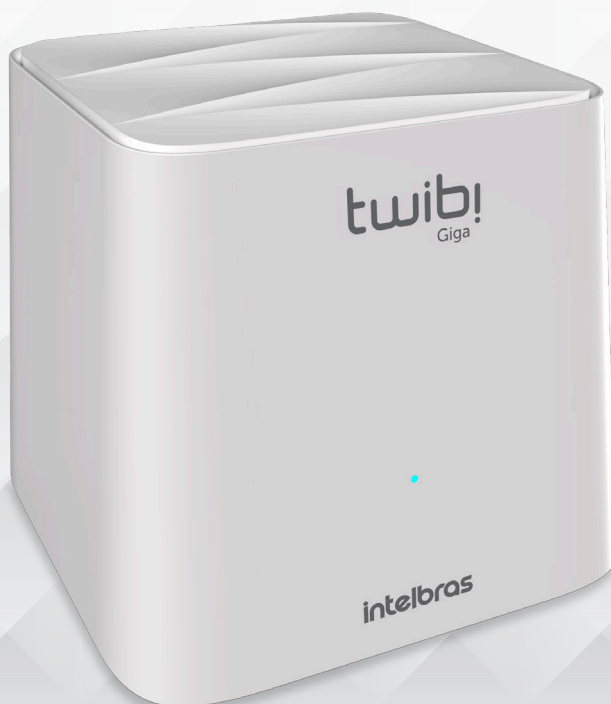
Roteador wireless Mesh