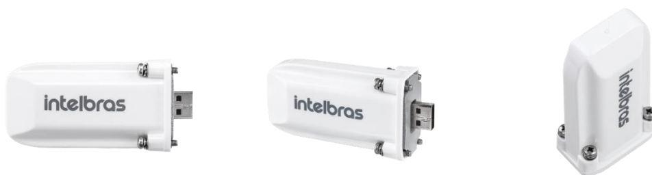
Foto do Pocket Wi-Fi EPW 2000 aplicado