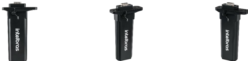
Foto do Pocket Wi-Fi EPWS 2000 aplicado